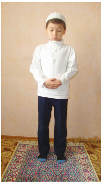
Өрләрниң қиямда туруши (3-шәкил)

Аяллар қоллирини мәйдилириниң үстидә тутиду (4-шәкил).