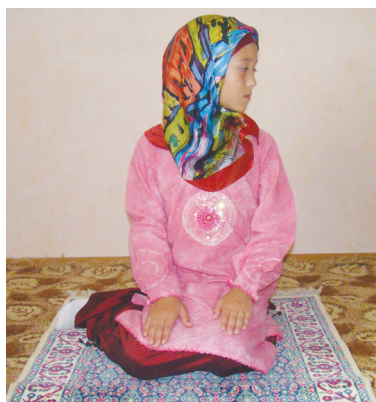
Салам бериш (12-шөкил)