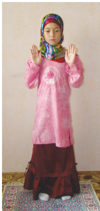
Аялларниң намазға башлиши (2-шәкил)