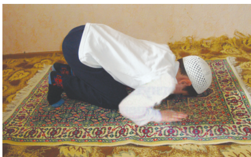
Әрләрниң сәждә қилиши (8-шәкил)

Сәждигә бериштин авал тизлиримизни, андин қоллиримизни, андин пешанимиз билән бурнимизни бирақла йөргә қойимиз (8-шәкил). Сәждидә әрләр қосақлирини тизлириға тәккүзмәстин егиз тутиду.