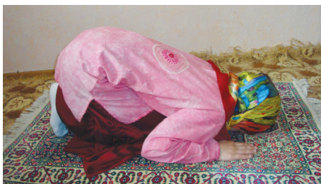
Аялларниң сәждә қилиши (9-шәкил)

Сәждидә үч кетим “Субһәнә роббийәл әһлә” дәймиз.