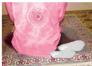
Аялларниң олтириши (11-шәкил)