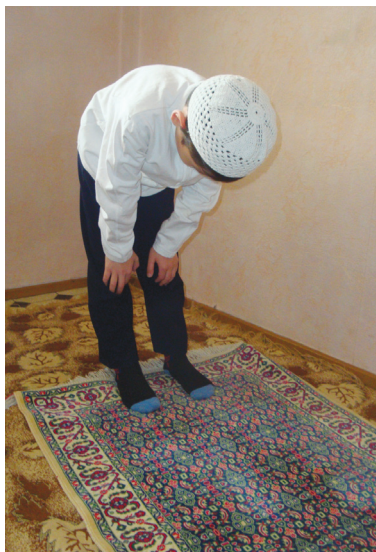
Әрләрнің рукуси (5-шәкил)

Сүрә оқулуп болғандин кейин, “Аллаһу әкбәр” дәп тәкбир ейтип рукуға баримиз (егилимиз), рукуда алиқанлиримиз билән тизлиримизни тутуп, сиртимиз, белимиз вә бешимизни түп-түз қилған һалда туруп (5-шәкил), үч кетим “Субһәнә роббийәлʔәзим” дәймиз.