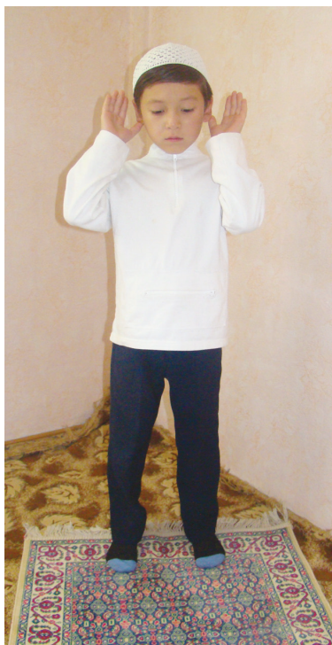
Әрләрниң намазға башлиши (1-шәкил)

Авал намаз оқуш үчүн пакизә таһарәт елип, жәйнамазға келимиз. Жәйнамазның үстидә қиблигә қариган ҳалда туруп ичимиздә “Аллаһ үчүн бамдат намизиниң сүннитини оқушқа нийәт қилдим” дөп нийәт қилип, баш бармақлиримизниң училирини кулақлириниң юмшақлириға тегидиган шәкилдә (1-шәкил) – қоллиримизни жуқури көтирип “Аллаһу әкбәр” дәймиз. Аяллар бармақлириниң учлирини иңәклиригә тегидиган шәкилдә (2-шәкил) – қоллирини жуқуриға көтириду. Икки путимизниң арисини төрт бармақ азадә сикқидәк шәкилдә оқуқ тутимиз.