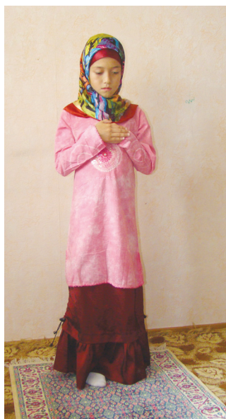
Аялларниң қиямда туруши (4-шәкил)