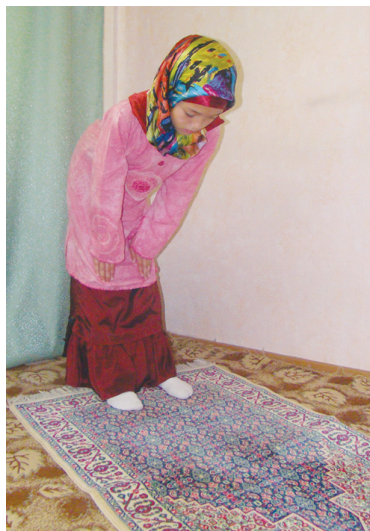
Аяллар рукуда әрләрнің әксичә йерим егилиду (6-шәкил).